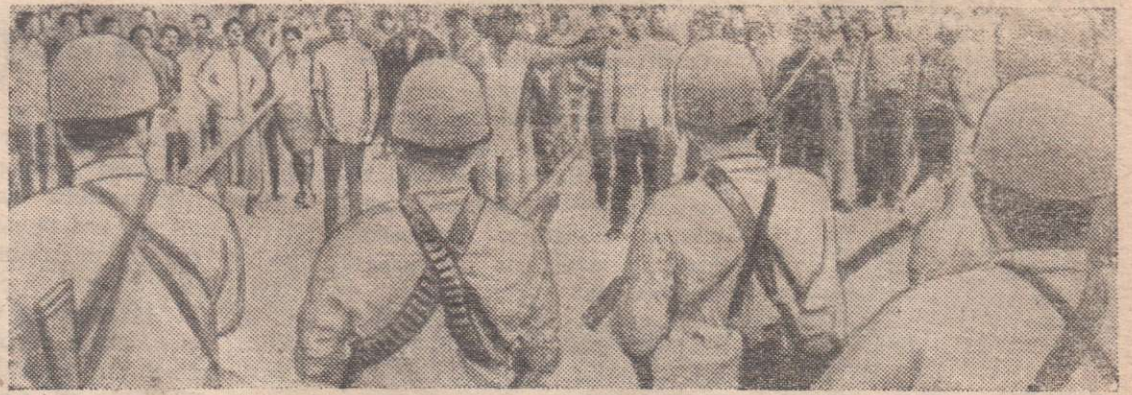
В Соединенных Штатах продолжают демонстрацию негритянского населения в Новом Орлеане.

Коллекционирование и ержавой колючей проволоки стало в Америке одним из модных увлечений. Любители готовы уплатить за хороший образец 50 долларов, а недавно кусок проволоки длиной 35 сантиметров был продан за 100 долларов.