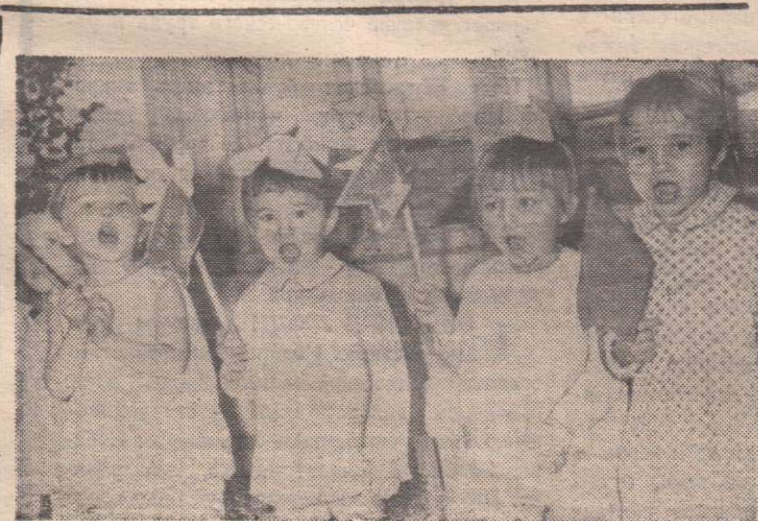
В Дзержинском детском саду №1.